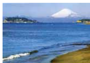
神奈川 -035 稲村ヶ崎の海浜 4992617606651