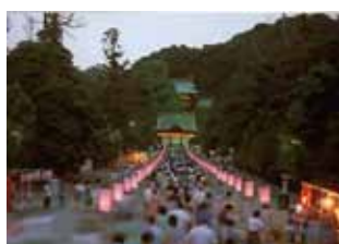
神奈川 -037 八幡宮ぼんぼり祭り 4992617608556