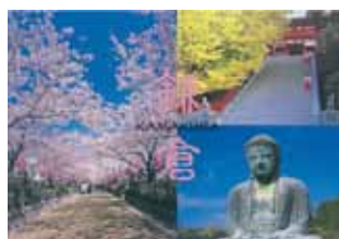
神奈川 -005 鎌倉 4992617605562