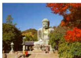
神奈川 -009 秋の鎌倉大仏 (高德院) 4992617605609