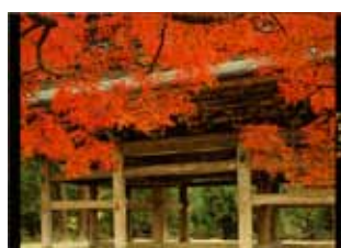
神奈川 -012 円覚寺 4992617605630