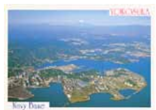
神奈川 -034 横須賀港上空より鎌倉、江ノ島、 富士山を望む。 4992617606637