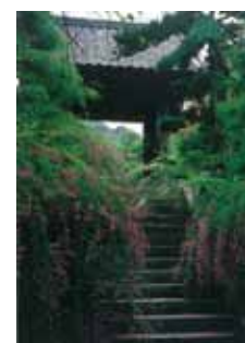
神奈川 -039 海蔵寺山門前の石段を美しく彩る萩 4992617602806