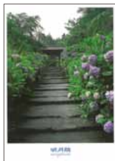
神奈川 -017 明月院 4992617605685