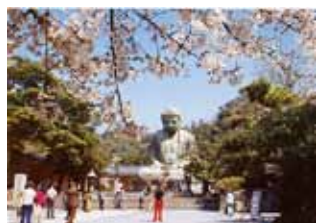
神奈川 -026 鎌倉の大仏 4992617606170