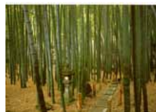
神奈川 -013 報国寺の竹庭 4992617605647