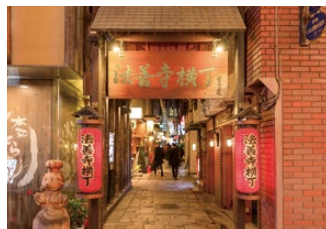
大阪-050 夜の法善寺横丁 4992617098548