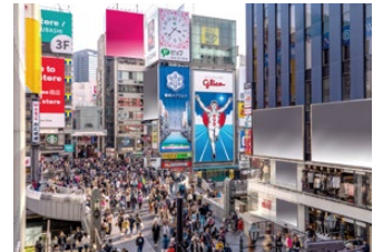
大阪-044 道頓堀・戎橋付近 4992617098173