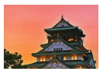
大阪-035 夕暮れの大阪城 4992617413037