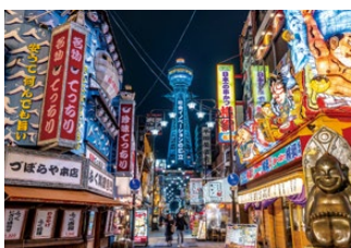
大阪-045 大阪 新世界の夜景 4992617098364