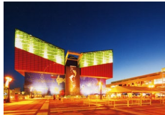
大阪-041 海遊館夜景 4992617417479