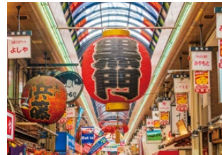
大阪-043 大阪 黒門市場 4992617098166