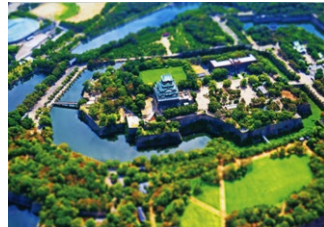
大阪-037 空から見た大阪城 4992617417431