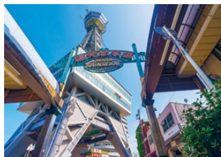
大阪-051 通天閣本通 4992617098555