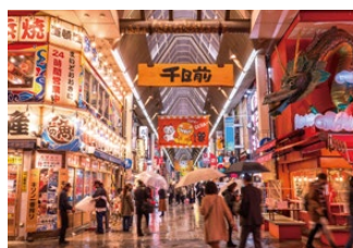
大阪-047 道頓堀・千日前商店街 4992617098388