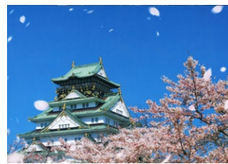
大阪-034 桜舞う大阪城 4992617413020