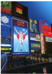
大阪-032 戒橋より 4992617413006