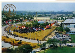
TM-015 選手村と各国々旗(昭和39年) 4992617011646