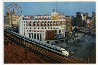
TM-004 有楽町日劇附近(昭和30年代中頃) 4992617011530