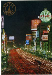
TM-001 銀座夜景大観(昭和30年代中頃) 4992617011509