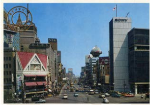
TM-002 数寄屋橋(昭和40年代前半) 4992617011516