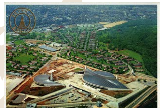
TM-013 オリンピック選手村(昭和39年) 4992617011622