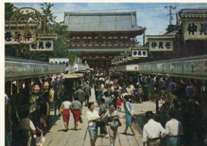
TM-007 仲見世(浅草/昭和30年代後半) 4992617011561