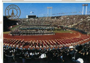
TM-011 東京オリンピック大会(入場式/昭和39年) 4992617011608