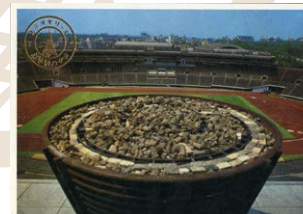
TM-012 聖火台(昭和39年) 4992617011615