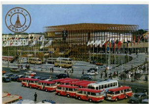
TM-014 東京オリンピック選手村のメイン・ゲート (昭和39年) 4992617011639