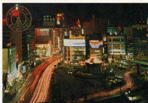
TM-006 夜の新宿(東口/昭和40年代前半) 4992617011554