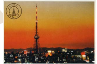
TM-009 夕焼けのなかの東京タワー/東京 4992617011585