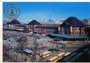
TM-008 東京駅(昭和30年代中頃) 4992617011578