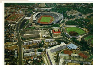
TM-016 明治オリンピック公園(昭和39年) 4992617011653

※ 流動商品のため、在庫についてはお問い合わせください。 ※ 実際の商品はカタログと異なる場合がございます。ご了承下さいませ。