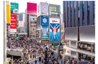
大阪-044 道頓堀・戒橋付近 4992617098173