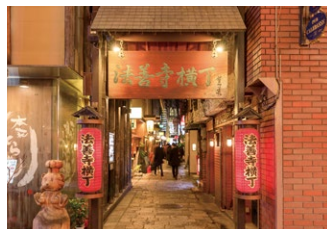
大阪-050 夜の法善寺横丁 4992617098548