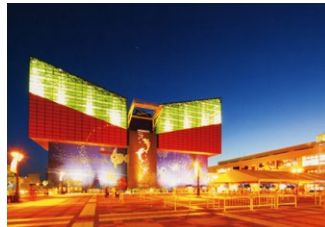
大阪-041 海遊館夜景 4992617417479