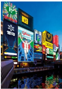
大阪-032 戒橋より 4992617413006