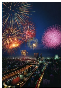
大阪-033 大阪城と花火 4992617413013