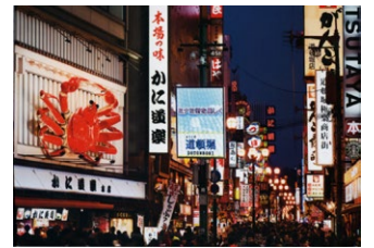
大阪-031 道頓堀 4992617412993