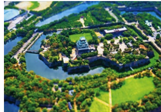
大阪-037 空から見た大阪城 4992617417431