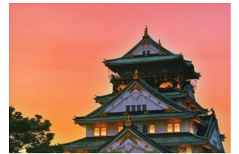
大阪-035 夕暮れの大阪城 4992617413037