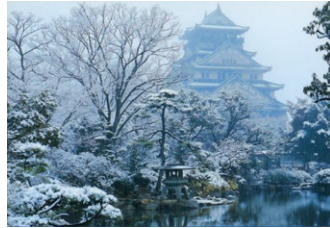
大阪-020 雪の中の大阪城 4992617206370