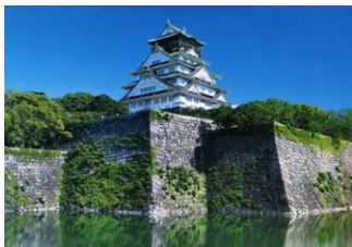
大阪-036 大阪城（お堀より） 4992617413044