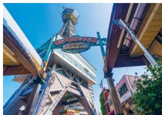
大阪-051 通天閣本通 4992617098555