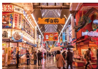
大阪-047 道頓堀・千日前商店街 4992617098388