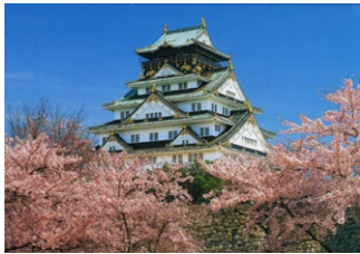
大阪-002 大阪城・4月 4992617202211

※ 実際の商品はカタログと異なる場合がございます。ご了承下さいませ。 ※ 流動商品のため、在庫についてはお問い合わせください。