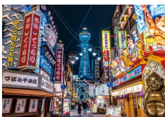
大阪-045 大阪 新世界の夜景 4992617098364