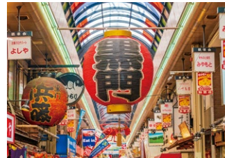
大阪-043 大阪 黒門市場 4992617098166