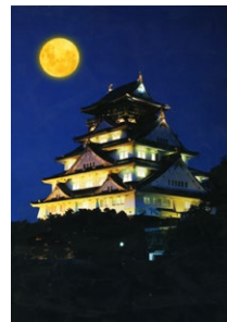
大阪-038 月と大阪城 4992617417448