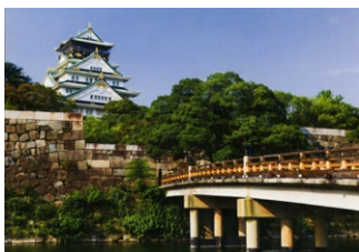
大阪-040 大阪城（極楽橋より） 4992617417462