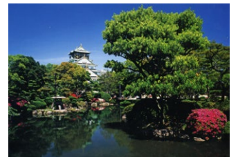
大阪-039 大阪城（日本庭園より） 4992617417455