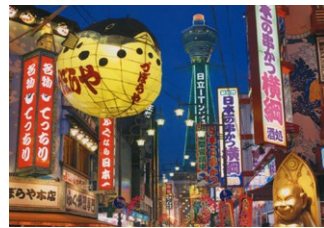
大阪-030 大阪・新世界 4992617998886