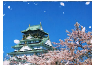
大阪-034 桜舞う大阪城 4992617413020